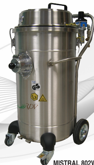
MISTRAL 802WDS AIREX